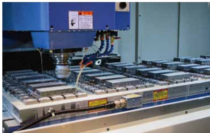
マシニングセンターでワークの多数個同時加工