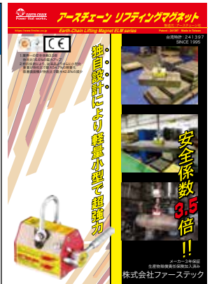
リフティングマグネット