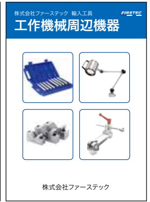
工作機械周辺機器