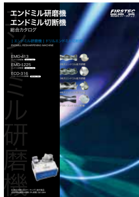
エンドミル研磨機