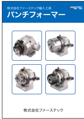
パンチフォーマー