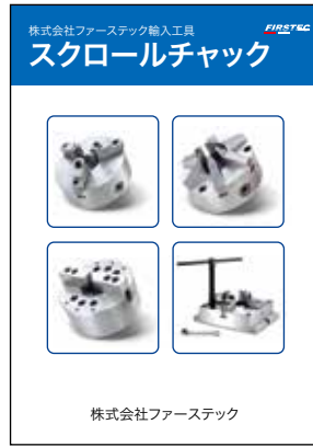
スクロールチャック