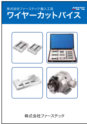
ワイヤーカットバイス